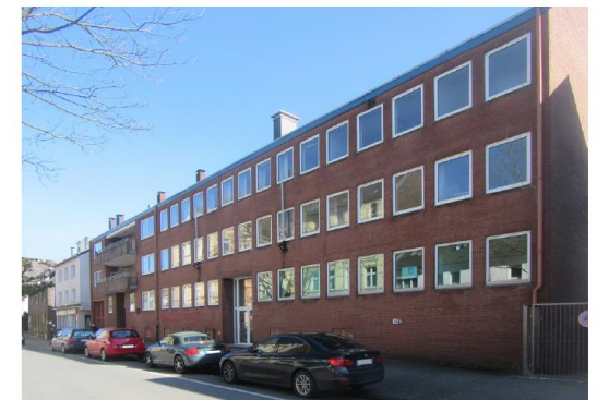
Bestand – Alte Benninghofer Str. 16-18, Dortmund-Hörde

Haben Sie Lust ein Teil eines WIR Projektes in einer verlässlichen Nachbarschaft zu werden und mit uns gemeinsam in die alte Polizeiwache zu ziehen?