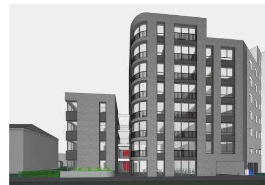
Wohnung ca. 112qm